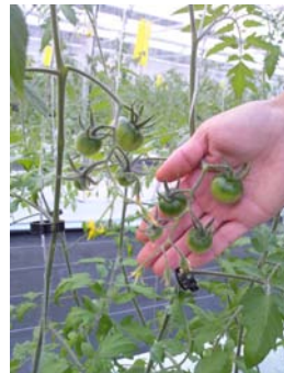
◎水分ストレスにより極限に絞られたトマト