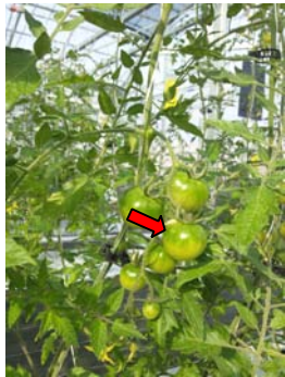
◎糖度が上がっているマーク グリーンベースがくっきり！