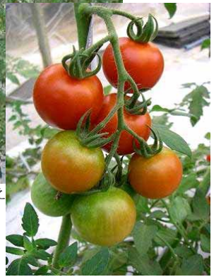
高糖度フルーツトマト