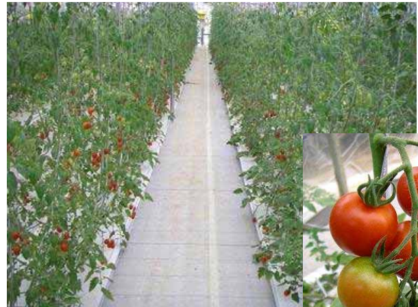
ハウス内は常に清潔にスリッパに履き替え作業します。

アイメックのもう一つの特徴は病原菌、ウイルスなどを通さない“ ハイドロメンブラン ”によってたとえ養液が汚染されても作物が病気になるらず、農薬の使用が大幅に削減できます。