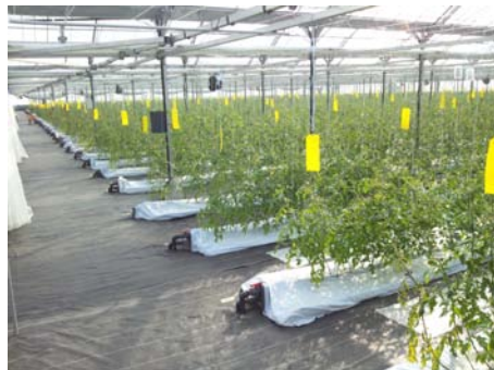
◎グラウンドシートにより土壌から隔離して、ドリフト被害防止。 ハウス内はいつも清潔に徹底管理